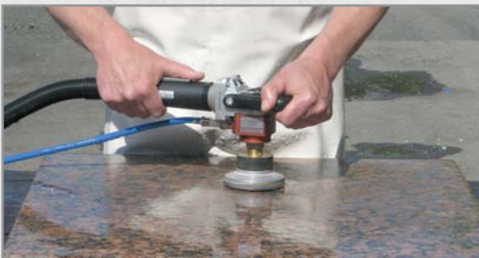
Bild: Einsatz in Verbindung mit GADIA ANTISHOCK zum vibrationsarmen Arbeiten.

Kugellagerung der Spindel im Spülkopf mit darunterliegenden Wasserdichtungen.